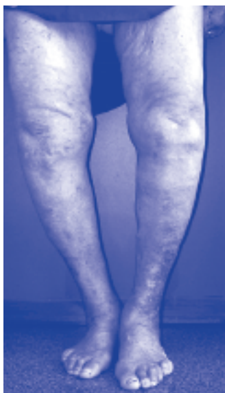
Figura 3. Arqueamiento de las rodillas por artrosis.