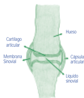
Figura 1. Esquema de una articulación normal.

La artrosis es una enfermedad que lesiona el cartilago articular y origina dolor, rigidez e incapacidad funcional. Habitualmente se localiza en la columna cervical y lumbar, algunas articulaciones del hombro y de los dedos de las manos, la articulación de la raíz del pulgar, la cadera, la rodilla y la articulación del comienzo del dedo gordo del pie (figura 2).